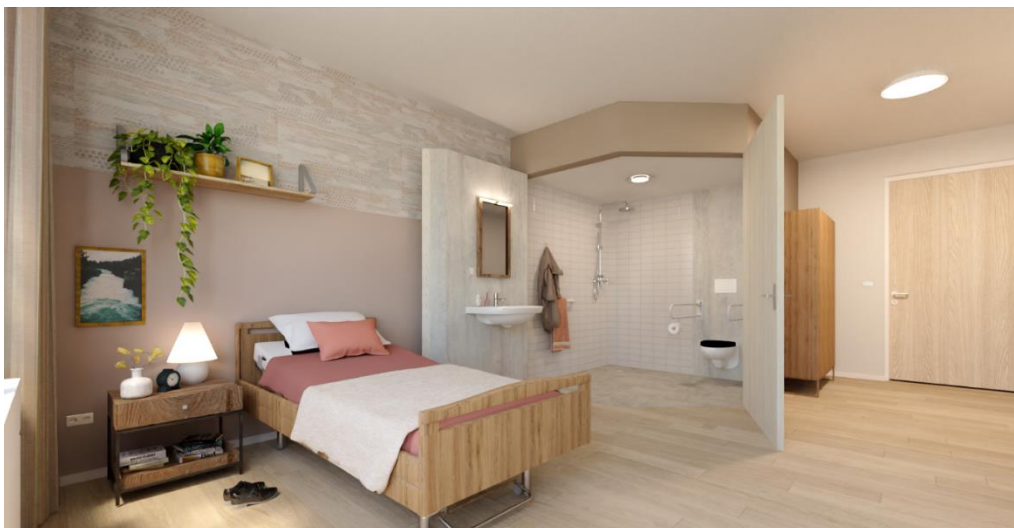
Kamer in het nieuwe Daelhoven met flexibele badkamer

Bovenaan deze nieuwsbrief kunt u zien hoe Daelhoven er na de verbouwing uit zal zien. Hieronder staan enkele afbeeldingen van die een beeld geven van hoe het binnen gaat worden.